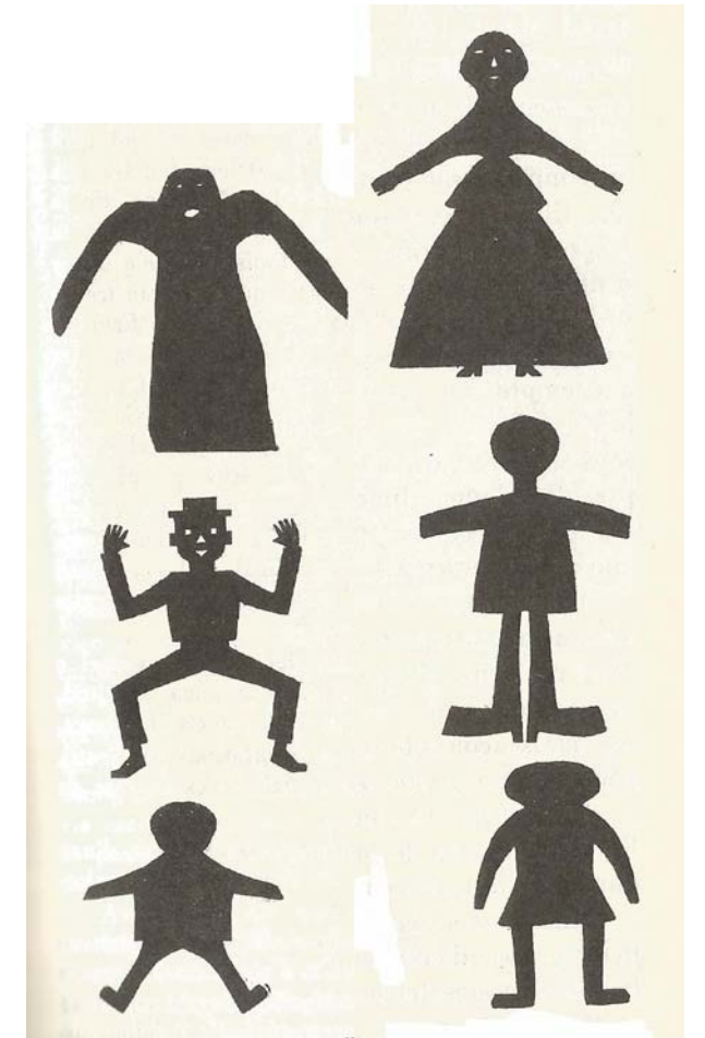
Ninots de paper que penjaven a tall de llufes, trobats i recollits a Barcelona els anys 1941, 1946 i 1947.

I, per acabar i com a curiositat, aquests ninots retallats que anomenem "llufes" no es refereixen a les ventositats sense soroll que porten el mateix nom, sinó que tenen un sentit mític: Les "llufes" són uns esperits eteris, éssers d'aire o vent, semblants a fades o follets. Hom creu que cap a final d'any rondan per tot arreu, silencioses i entremaliades, mofant-se de la gent massa innocent, escarnint-la o amoinant-la. Per això en diem així del ninot de paper que es penja a l'esquena el dia dels Sants Innocents.