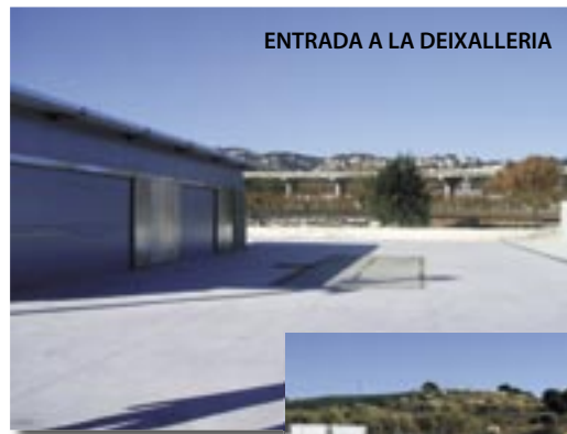
ON S'UBICARAN ELS CONTENIDORS